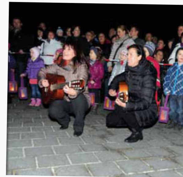
Das alljährliche Fest des Heiligen Martin wurde auch heuer wieder mit einem Laternenfest und einem szenischen Spiel von den Kindern des Pfarrkindergartens am Kirchplatz gefeiert.

Fotos und ausführliche Artikel zu diesen und weiteren Veranstaltungen unter http://www.dekanat.at/dekanat/rein/frohneiten/