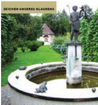
Pavillon und Franziskusbrunnen