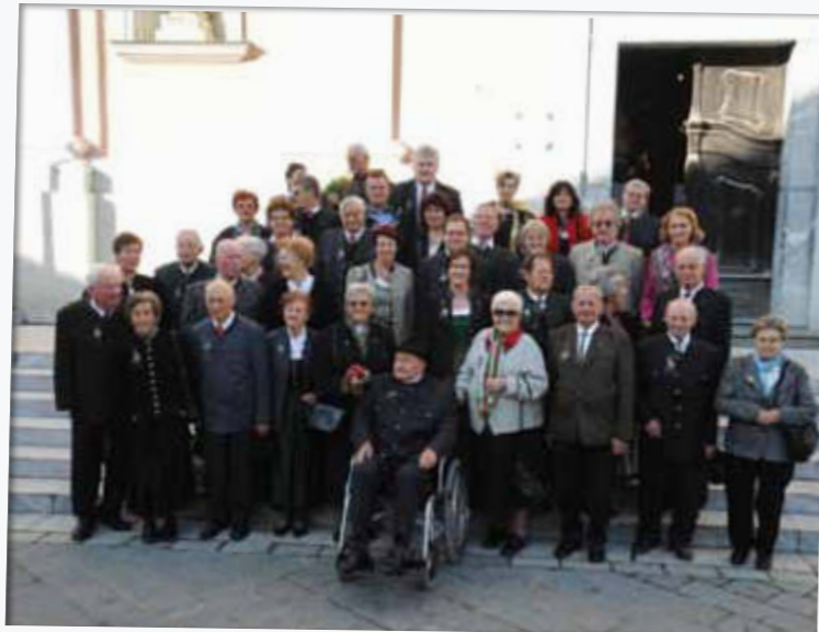
Der Ausschuss für Ehe und Familie organisierte die heurige Jubelmesse Blumen, Pralinen, die eine oder andere Aufmerksamkeit,..... es muss wohl ein besonderer Tag sein. Erinnerungen an den Hochzeitstag, für manche vor 25 Jahren, für einige vor 50 Jahren und für wenige sogar vor 60 Jahren, werden wach.

ein ausführlicher Bericht von Mag. Anton Wieser auf unserer Homepage